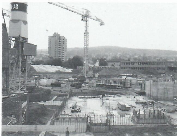
Blick zum Schultrakt I. Scorcio panoramico del 1. lotto della scuola

im Schultrakt I: mit den Kellerwänden Schultrakt II: Fundamentplatte Mensatrakt III: Erdarbeiten Turnhalle- trakt IV: Installationen