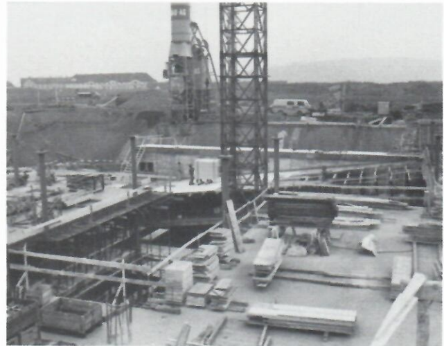
Parkhaus, una delle tante solette e rampa di scorrimento dopo il disarmo.

Blick in eine Arbeitsetappe mit Decken und Auffahrtsrampen