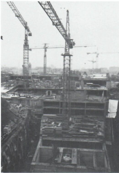
Südanblick des Parkhauses

Scorcio di una sezione al Parkhaus Hirschel.