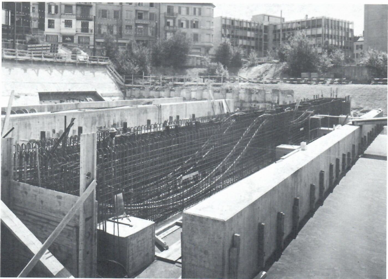
Blick in die Trägerarmierung mit Kabellagen und Grössenvergleich durch Eisenleger in der Armierung.